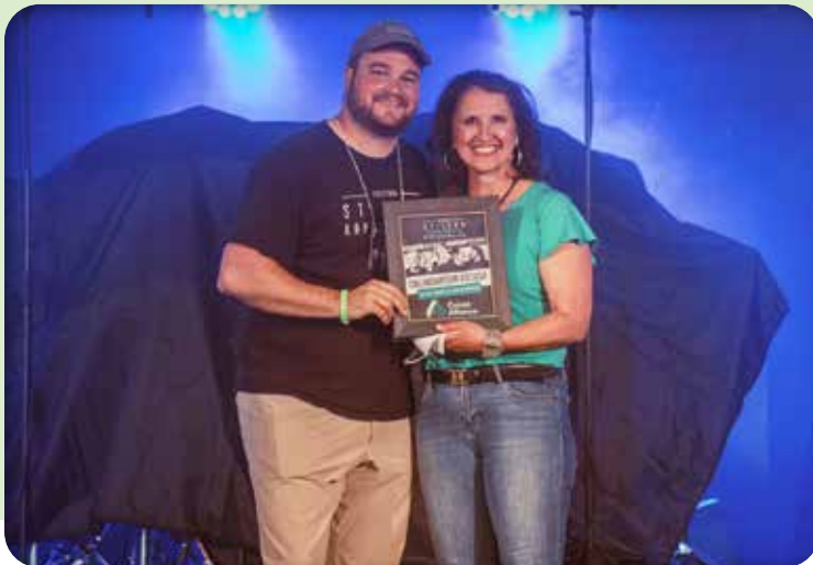
Région Nord-Centre Festival de la St-Jean de Kapuskasing

Ce budget permet d'appuyer des projets porteurs nécessitant un soutien financier de moins de 10 000 $.