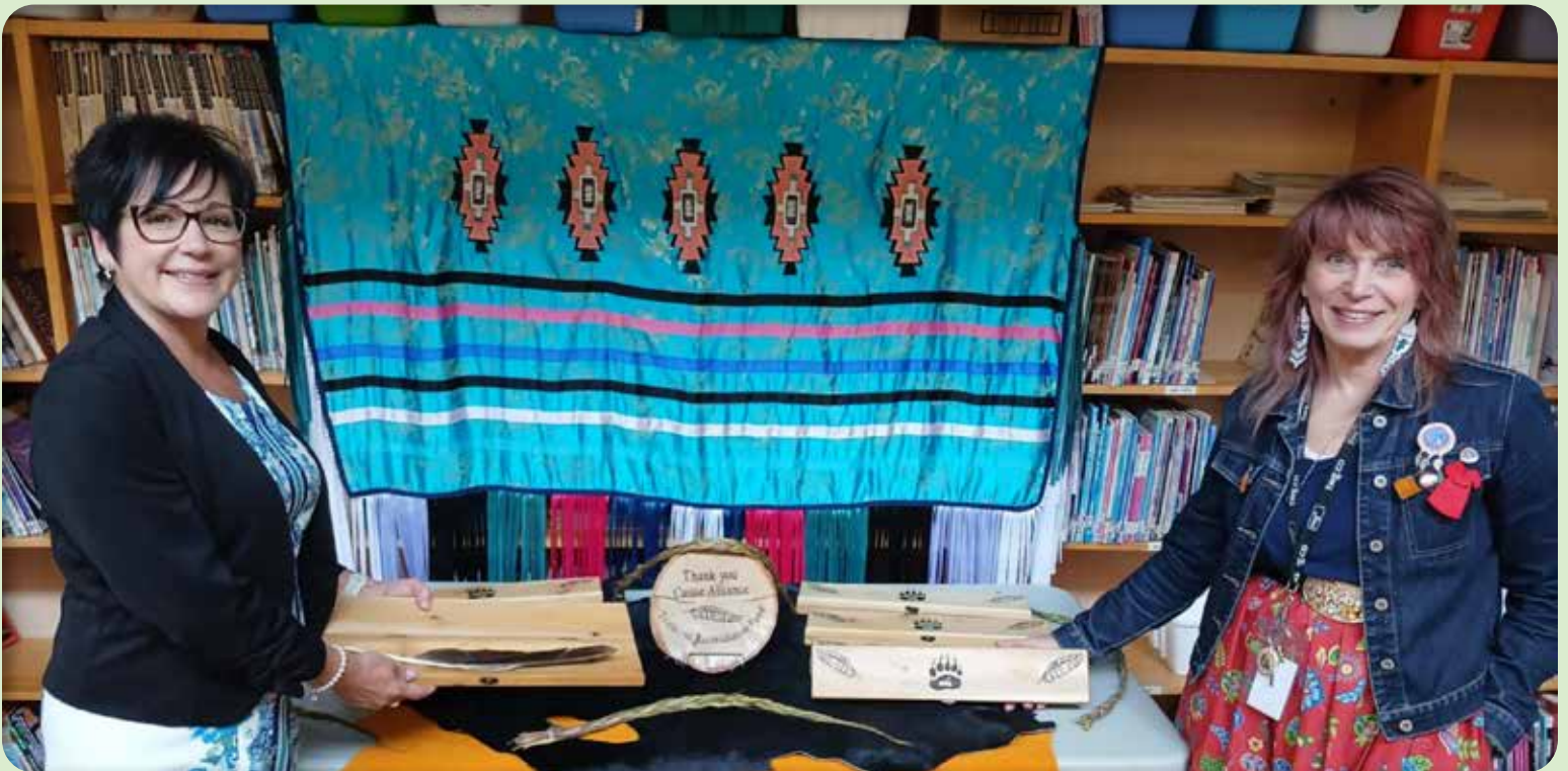
Région du Nipissing-Centre White Woods Feather Boxes

Chaque année, la somme de 6 000 $ est disponible pour l'ensemble du territoire desservi par la Caisse Alliance. Le formulaire de demande est disponible dans nos centres de services ainsi que sur notre site Web.