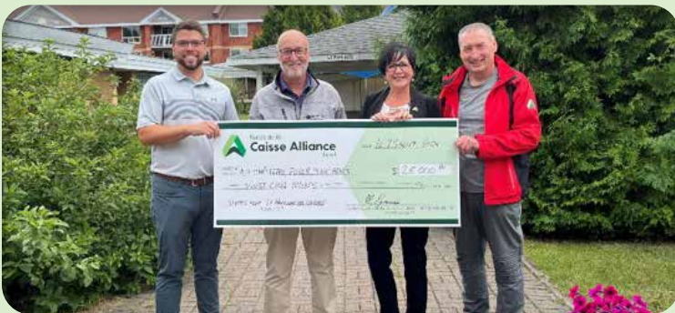
Région du Nipissing-Centre Au Château