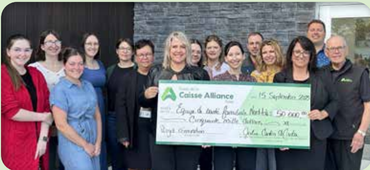
Région du Nord-Ouest Équipe de santé familiale Nord-Aski