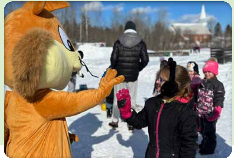
Région du Nipissing-Ouest École St-Charles Borromée