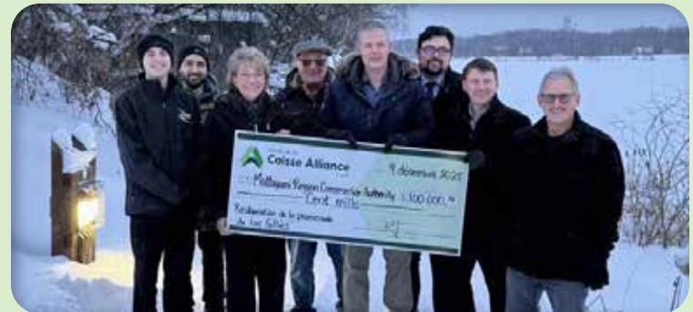
Région du Nord-Est Mattagami Region Conservation Authority