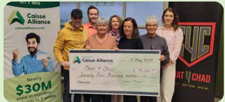
Région du Nipissing-Est Chat4Chad